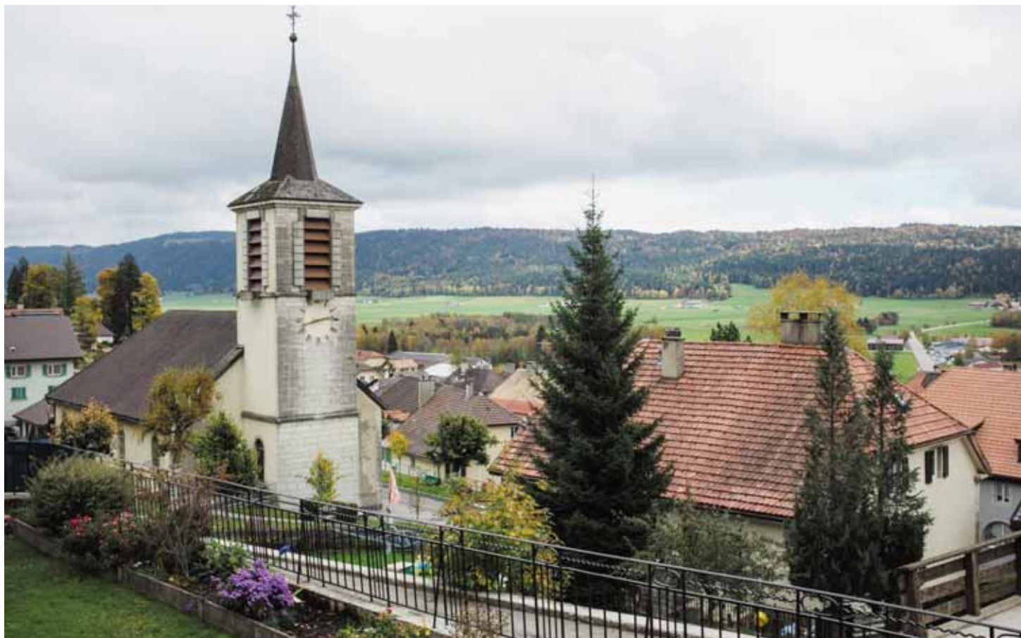
Les huit petites communes des Montagnes, comme ici Les Ponts-de-Martel, doivent constituer leurs conseils communaux, des postes de plus en plus exposés compte tenu de dossiers qui se complexifient.

A l'issue des élections communales du 5 juin, le point sur les huit petites communes des deux districts des Montagnes, qui ont toutes un Conseil communal à pourvoir ou repourvoir, qu'il y ait Entente communale ou pas. Un exercice qui suivant les cas devient difficile, tant l'engagement civique achoppe à des dossiers de plus en plus complexes.